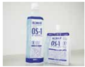
飲みやすいゼリータイプもあります

『OS-1』は代表的な経口補水液のひとつ。薬局等で気軽にお買い求め頂けますが、他の飲料に比べて塩分が多く含まれているので、健康な状態での多飲は避けましょう。経口補水液による薬の服用も避けた方がいいといわれていますので、ご注意下さい。